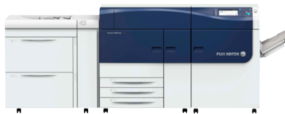
Versant™ 2100 Press

印刷市場では、一人ひとりの嗜好を反映したパーソナル印刷や、多様なニーズに合わせた少部数印刷が可能なオンデマンド印刷の需要が高まっています。富士ゼロックスでは、この需要に応えるべく、企業内用途などを想定したモデルから、商業印刷分野での活用を想定したハイエンドの大型機まで、幅広いモデル展開を行っています。2014年5月には、新商品「Versant™ 2100 Press」を導入。さらなる高画質化、厚紙対応の強化によりパッケージ用途への応用を広げるなど、基本性能の向上を図りながらコストパフォーマンスにも配慮した商品で、一層の普及拡大を狙っていきます。